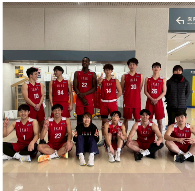
緊張から解放された選手たち